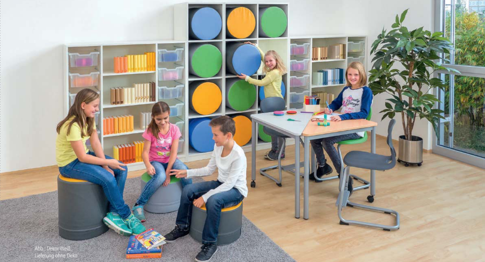
Abb.: Dekor Weiß, Lieferung ohne Deko