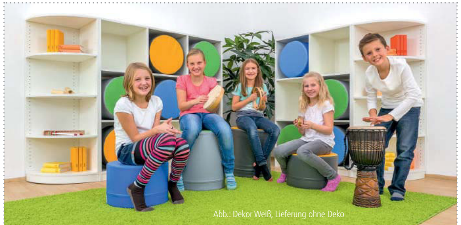
Abb.: Dekor Weiß, Lieferung ohne Deko

Die handlichen und farnefrohen Polsterhocker können einerseits querkant ordentlich in die Polsterhockerregale bzw. -schränke verstaut werden, andererseits können die Hocker herausgenommen werden, um z. B. zu einem Kreis zusammengestellt zu werden. Verschiedene Lernsituationen können kinderleicht aufgebaut werden, die die dynamischen Lernprozesse fördern und unterstützen. Nutzen Sie Ihren Raum vielseitig. Mit der Lösung, Ihre Polsterhocker sinnvoll zu verstauen, schaffen Sie wieder Raum für weitere Lernkonzepte.