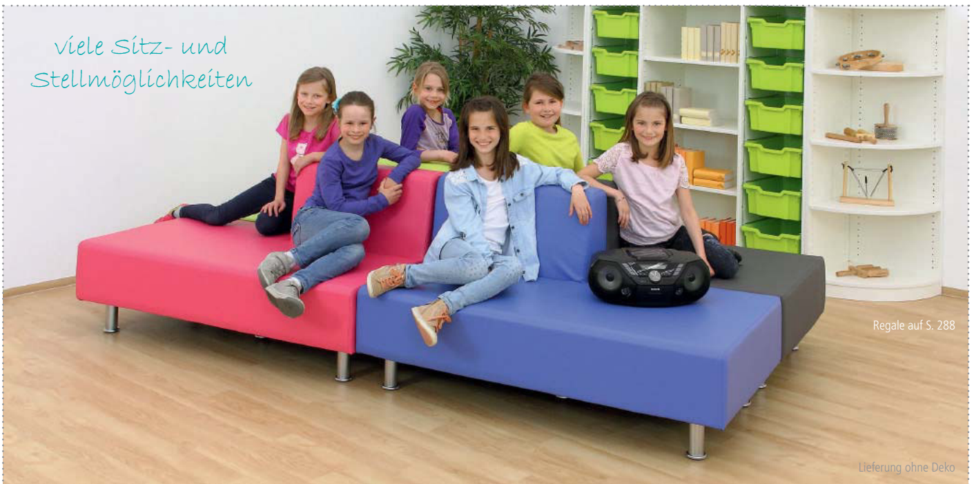
Regale auf S. 288