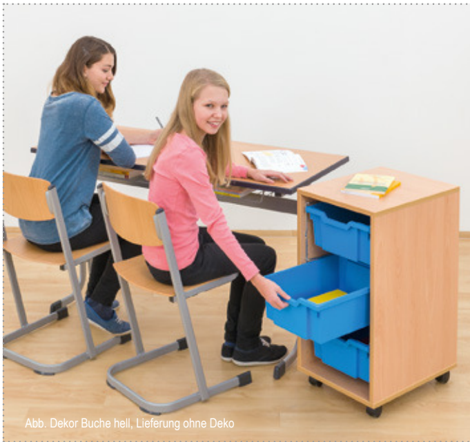
Abb. Dekor Buche hell, Lieferung ohne Deko

Vorteile der Gratnells Materialboxen finden Sie auf S. 21.