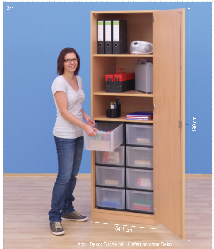
Abb.: Dekor Buche hell, Lieferung ohne Deko

Aufgebaut geliefert • Frei Verwendungsstelle • 5 Jahre Garantie