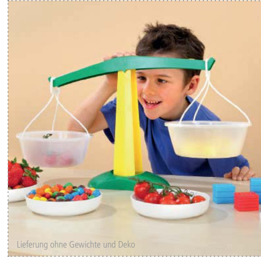
Lieferung ohne Gewichte und Deko