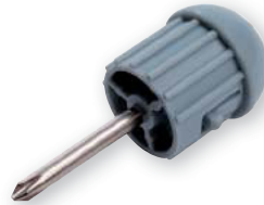
Kappe mit Schraubendreher