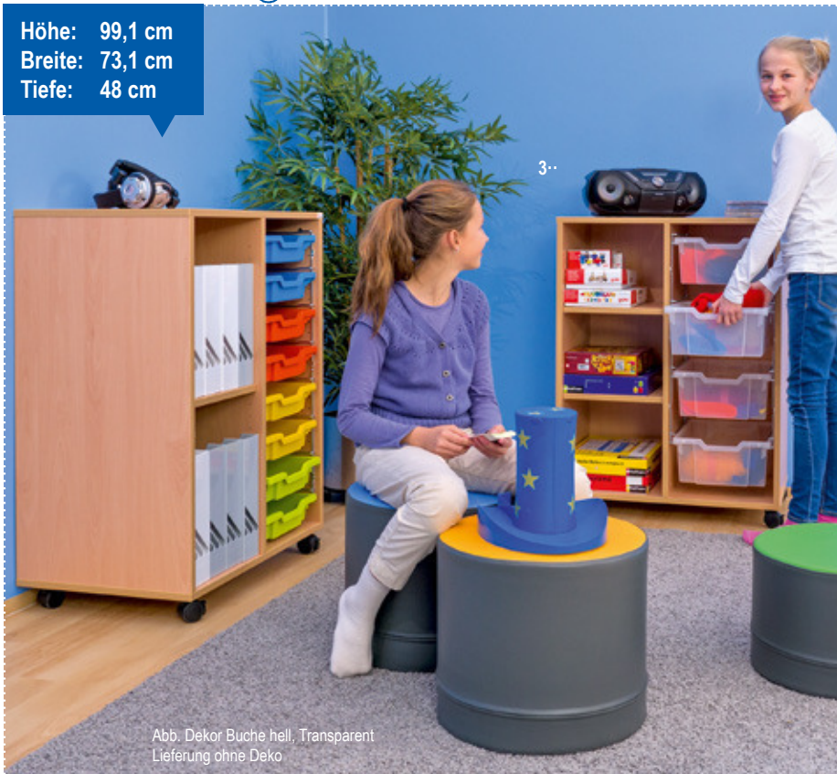
Abb. Dekor Buche hell, Transparent Lieferung ohne Deko

Höhe: 99,1 cm Breite: 73,1 cm Tiefe: 48 cm