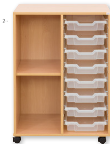
Abb.: Dekor Buche hell