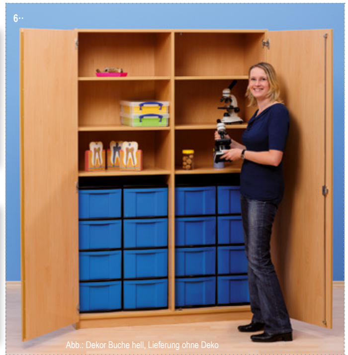
Abb.: Dekor Buche hell, Lieferung ohne Deko

Hohe Tragkraft der Fachböden dank Mittelwand