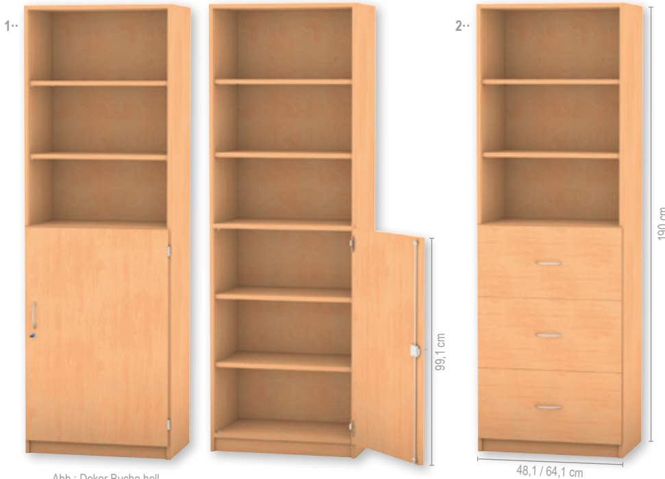
Abb.: Dekor Buche hell

1·· Hochschrank, 1 Drehtür, 5 Fachböden, davon 4 verstellbar (individuell einstellbar)