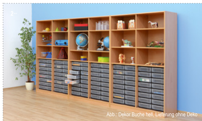
Abb.: Dekor Buche hell, Lieferung ohne Deko

Aufgebaut geliefert • Frei Verwendungsstelle • 5 Jahre Garantie