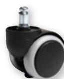
Hartbodenrollen Aufpreis € 10,-